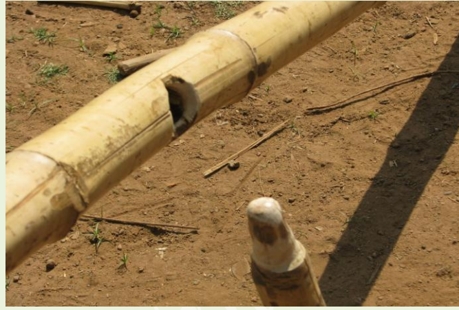
ஏற்ற - இறக்கம் செய்யும் முறை