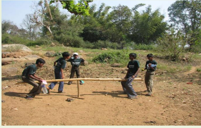
ஏற்ற - இறக்கம் சிறுவர் விளையாட்டு