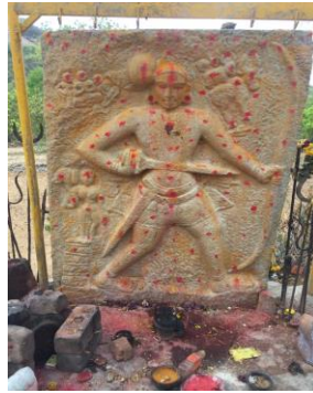
ஆநிரை மீட்டலுக்கான நடுகல்

இடையில் கச்சையுடன் கூடிய வாரும் உள்ளது. அவ்வீரனின் இடது தலைப்பகுதியில் மூன்று மாடுகளின் பொறிப்பு உள்ளன. இப்பொறிப்பு ஆநிரை மீட்டலுக்கானது என்பது பறைச்சாற்றுவதாக அமைந்துள்ளன. வலது தலைப் பகுதியில் தேவக்கன்னியர்களின் உருவங்கள் தென்படுகின்றன. இவ்வீரன் போரிட்டு இறந்த பின் தேவக் கன்னிகளான இரம்பை, ஊர்வசி, மேனகை ஆகியோரால் தேவலோகம் (சொர்க்கம்) அழைத்துச் செல்லப்பட்டார் என்பதை விளக்குவதாக உள்ளது. மேலும் வீரனின் வலது கால் பகுதியில் பெண் பொறிப்பு ஒன்றும் உள்ளது. அப்பெண் நின்ற கோலத்தில் காட்சி தருகிறார். இடது கையை தொங்க விட்ட நிலையிலும், வலது கையில் கற்குடமும் உடன்கட்டை ஏறியதற்கான அடையாள முத்திரையோடு வடிவமைக்கப்பட்டுள்ளது. அப்பெண்ணானவள் தலையில் கொண்டையும், காதுகளில் குண்டலங்களும் அணிந்துள்ளாள். இப்பகுதி மக்கள் இந்நடுகல்லை சிலையப்பசுவாமி (அ) செல்லப்பசாமி என்ற பெயரில் வணங்கி வருகின்றனர். மேலும் இக்கல்லிற்கு ஆடு, மாடு, கோழிகளை பலியிட்டும், குங்குமம், மஞ்சள் இட்டும் வழிப்படுகின்றனர் இக்கல்லின் அருகிலுள்ள மரங்களில் ஆடு, மாடு, கோழிகளை பலியிட்டதற்கான சான்றுகள் உள்ளன.