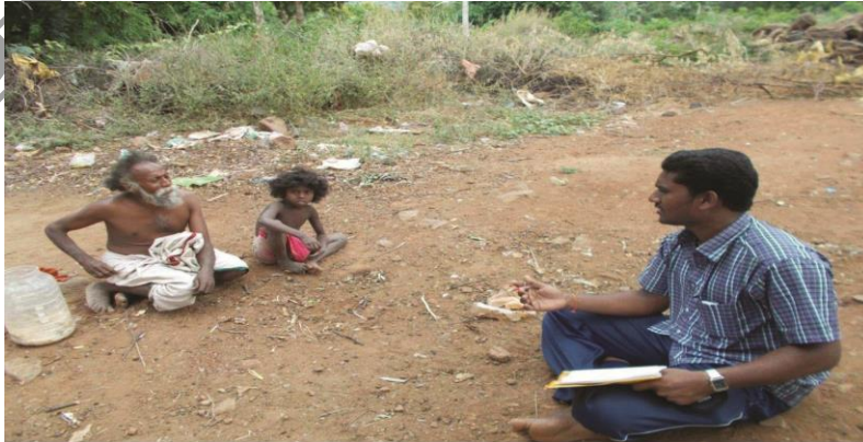
பளியர் இனத் தலைவரோடு தகவல் சேகரித்தபோது

பளியர்கள் திருமணம் அவர்களுக்கேயுரிய பாரம்பரிய முறைப்படி நிகழ்த்தப்படுகிறது. முன்பு வேங்கைமரத்தினடியில் பளிச்சியம்மனைச் சாட்சியாக வைத்து வள்ளிக்கொடியில் ஆண் பெண்ணின் கழுத்தில் தாலிகட்டும் வழக்கம் இருந்தது. தற்போது அவ்வழக்கம் இல்லை. ஆண்கள் சிறுவயதில் திருமணம் செய்துகொள்வதும் பலதாரமணம் அங்கீகரிக்கப்பட்டதாகவும் உள்ளது.