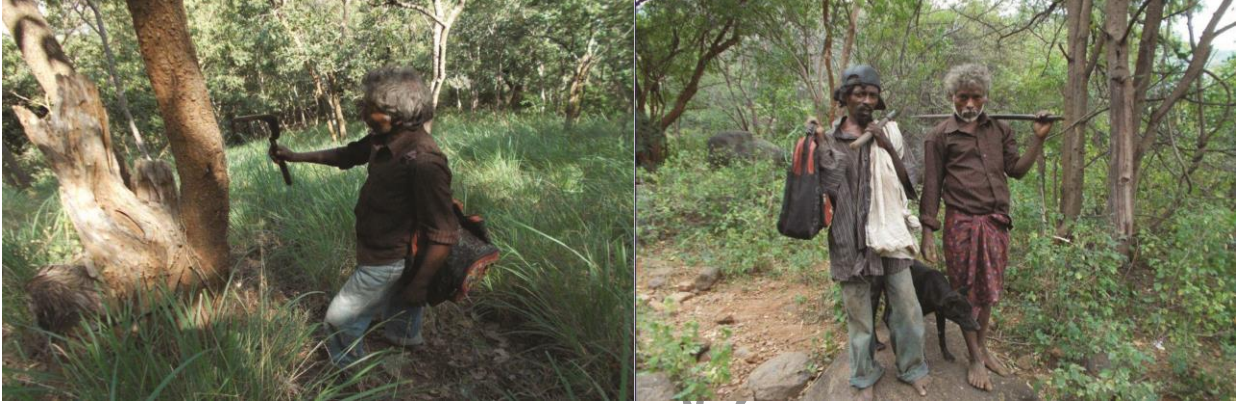
வேங்கை மரப் பால் சேகரித்தலும், தேனெடுக்கச் செல்லுதலும்

தேனீக்களின் ரீங்கார ஒலியைக் கூர்ந்து கவனித்து அவை செல்லும் திசையினை வைத்துக் கூடுகளைக் கண்டுபிடிக்கின்றனர். தவிர மிகக்கூர்மையான பார்வைத்திறனும் இவர்களுக்குண்டு. வெகு தொலைவில், மலையுச்சியில் உள்ள தேன்கூடுகளைக் கூட அடிவாரத்தில் இருந்தே மிகச் சரியாகக் கண்டுபிடித்துச் சொல்கின்றனர். அதேபோல மலைகளில் வாழும் பிற விஷமுள்ள உயிரினங்கள் கூட இவர்களைத் தீண்டுவதில்லை. சான்றாக, ஒரு மூலிகை வேரினை எப்போதும் இடுப்பில் கட்டிக் கொள்கின்றனர். அந்த வேரின் வாசனைக்குப் பாம்பு அருகில் வராது என்கின்றனர்.