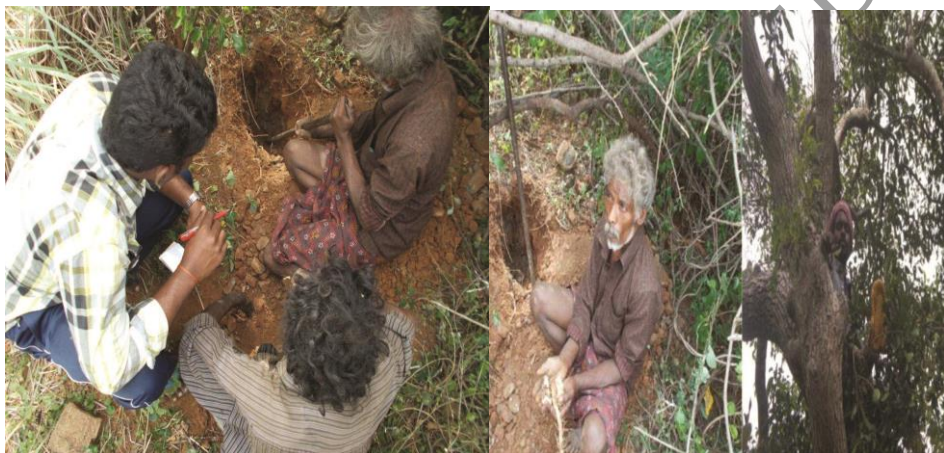
வள்ளிக்கிழங்கு தோண்டிய போது

பணம் ஈட்ட வேண்டும் என்கிற நோக்கில் பளியர்கள் தொழில் செய்வதில்லை. அடிப்படைத் தேவைகளைப் பூர்த்திசெய்யும் நோக்கிலேயே மலைக்குச் செல்கின்றனர். குறிப்பிட்டுச் சொல்வதென்றால், உணவுத்தேவையின் பொருட்டே தொழில் செய்கின்றனர். நிலையான, அதிக வருவாய் ஈட்டக்கூடிய தொழில் ஏதும் இவர்களிடம் இல்லை. மலைகளில் இயற்கையாகக் கிடைக்கக்கூடிய பொருட்களைச் சேகரிப்பதே இவர்களது தொழிலாகும். அவ்வகையில் தேன், வள்ளிக்கிழங்கு, கீரை வகைகள், காளான் மற்றும் மூலிகை வேர்கள் ஆகியவற்றைச் சேகரித்து விற்பதன் வாயிலாகக் கிடைக்கக்கூடிய தொகையில் தமது வாழ்வாதாரத்தை உறுதி செய்து கொள்கிறார்கள்.