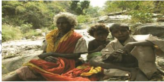
நெற்றியில் வேங்கைப் பால் பூசிய பளியர் இனச் சிறுவர்களும் மூதாட்டியும்

காடுகளில் வேட்டையாடியும் உணவு சேகரித்தும் வாழ்ந்து வந்த இவர்களின் புழங்குவெளி, வனங்கள் எஸ்டேட்களாக உருமாறியதில் சுருங்கிப் போனது. மேலும், காடுகளைப் பாதுகாக்கப்பட்ட வனங்களாக (Reserved Forest) ஆங்கிலேய அரசு அறிமுகம் செய்ததில்தான், இம்மக்களின் வாழ்க்கையிலேயே பெரும் இடர்ப்பாடுகளுக்குள்ளானது. அதிலும் குறிப்பாக, 1984ஆம் ஆண்டில் வனப்பொருள் சேகரிக்கத்தடை விதித்து, பளியர் சமூக மக்களைக் காடுகளை விட்டு வெளியேற்றும் முயற்சியை வனத்துறை மேற்கொண்டது. இருப்பினும் வெளிப்புற மக்களுக்கும் வனத்துறையினருக்கும் அஞ்சி ஒடுங்கி, காடுகளே தஞ்சம் என மலைச்சரிவுகளிலும், குகைகளிலும் இன்றளவும் இம்மக்கள் வாழ்ந்து வருகின்றனர். 'பழையர்' என்கிற பெயர்தான் மருவிப் பளியர் என்றாகியது என்ற கூற்றும் நிலவுகின்றது. இவர்களிடையே இரு பிரிவுகள் காணப்படுகின்றன. அதாவது, 'காட்டுப்பளியர்' 'புதைப்பளியர்'. காட்டுப்பளியர் என்போர் சிறிய அளவில் காட்டு வேளாண்மை செய்து வாழ்கின்றனர். புதைப்பளியர் என்போர் மலைக்குகைகள், தற்காலிகக் குடிசைகளில் வாழ்கின்றவர்களாவர். இவர்கள் தேனெடுத்தல், கிழங்கு தோண்டுதல், மூலிகைகள் சேகரித்தல் போன்ற தொழில் செய்பவர்களாவர். சிறுமலையினைப் பொருத்தமட்டில் மலையின் மேல்முகட்டில் ஒருசில காட்டுப்பளியர்கள் வாழ்கின்றனர். மலைச்சரிவுகளில் புதைப்பளியர்களே கணிசமாக வாழ்கின்றனர். இவர்களின் வாழ்வியலை நோக்கும் போது பண்டைய இனக்குழு மக்களின் மரபுசார் அறிவினையும் பண்பாடுகளையும் காணமுடிகின்றது.