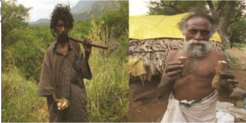
வெவ்வேறு வகையான மலைக்கிழங்குகள் தோண்டிய போது..

பளியர்களின் வாழ்வியல் நாடோடி வாழ்க்கையினை ஒத்ததாகவே உள்ளது. ஏனெனில் நிலையான குடியிருப்புகளை இவர்கள் அமைப்பதில்லை. எனவே, மரங்களையொட்டி அமைக்கப்படும் பரண்கள், குகைகள், பாறையிடுக்குகள், எளிய புற்களால் வேய்ந்து உருவாக்கப்படும் குடில்கள் இவர்களது வசிப்பிடங்களாகின்றன. தேனெடுக்க மலைச்சிகரங்களில் இரண்டு மூன்று நாட்கள் கூடத் தங்குகின்றனர். அவ்வாறு, தங்குகையில் தற்காலிகக் குடில்களை அமைத்துக் கொள்கின்றனர். 'போதைப்புல்' எனப்படும் புற்கள் உயர்ந்த மலைகளில் காணப்படும். இவற்றைக் கொண்டே தமது குடில்களை அமைக்கின்றனர். இப்புல் 5 அடி முதல் 6.30 அடி வரை வளரும் தன்மையுள்ளது. எப்போதும் ஒருவகை வாசனையை வெளியிடக்கூடியது. அந்த மணத்திற்குப் பாம்பு முதல் எந்தவகையான பூச்சியினங்களும் அண்டாது என்கின்றனர் இம்மக்கள். எனவே, இப்புற்களை வேரோடு பிடுங்கி அடுக்கிக் கூரையாக அமைப்பர். அடை மழை, கடுங்குளிரில் இருந்துகூட மலைவாழ் மக்களைப் பாதுகாக்கும். பளியர் இனத்தவரின் வழிபாட்டில் இப்புற்களுக்கு முக்கியமான இடம் உண்டு. தங்களது குலதெய்வமான பளிச்சியம்மன் உறையும் இடத்தை இப்புற்களைக் கொண்டே அலங்கரிக்கின்றனர்.